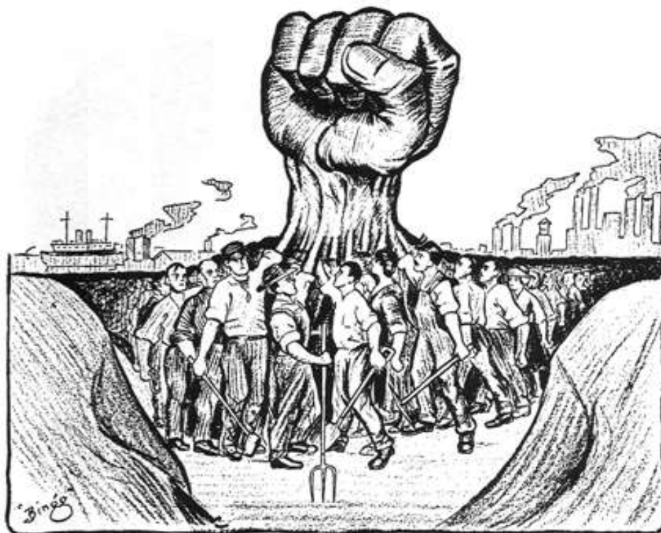
Solidarity, June 30, 1917. The Hand That Will Rule the World—One Big Union.