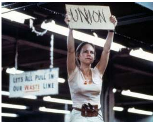
Foto yang saya tampilkan dalam gambar sampul adalah Norma Rae . Tokoh dari film klasik garapan sineas Amerika pada tahun 1979 dengan judul yang sama "Norma Rae". Walaupun tokoh cerita rekaan tetapi berdasarkan inspirasi kisah nyata. Cerita perjuangan buruh upah minimum yang bernama Norma Rae. Dia bekerja di pabrik kapas yang memiliki kondisi-kondisi kerja yang mengabaikan kesehatan para buruhnya. Awalnya dia mengabaikan hal ini karena kebutuhan akan biaya hidup dan kondisi dirinya mengharuskan dia bekerja pada pabrik tersebut.